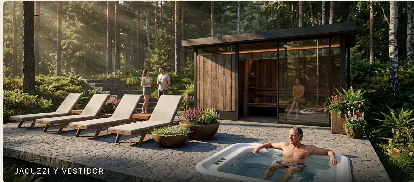
JACUZZI Y VESTIDOR