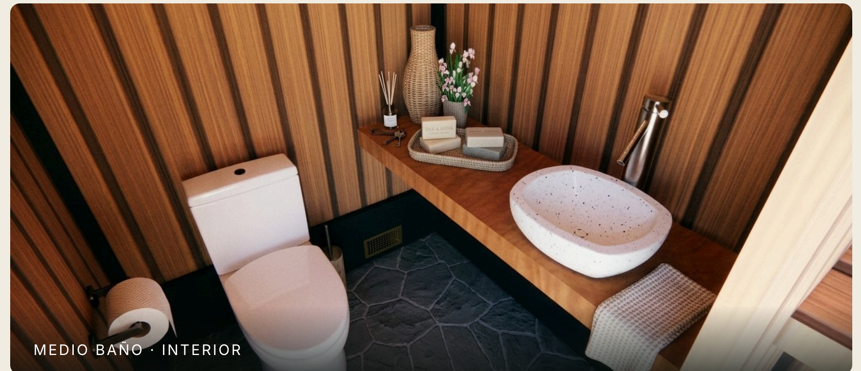
MEDIO BAÑO · INTERIOR