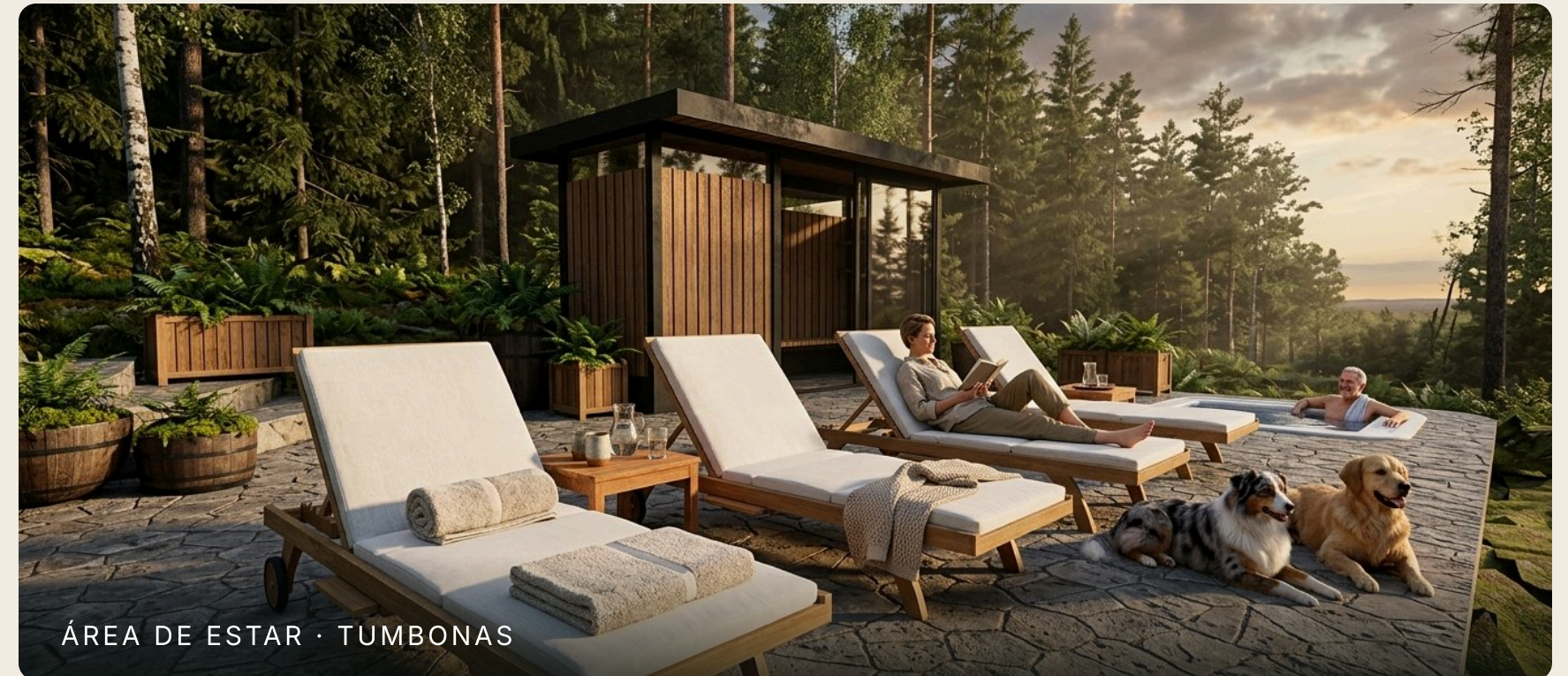
ÁREA DE ESTAR · TUMBONAS